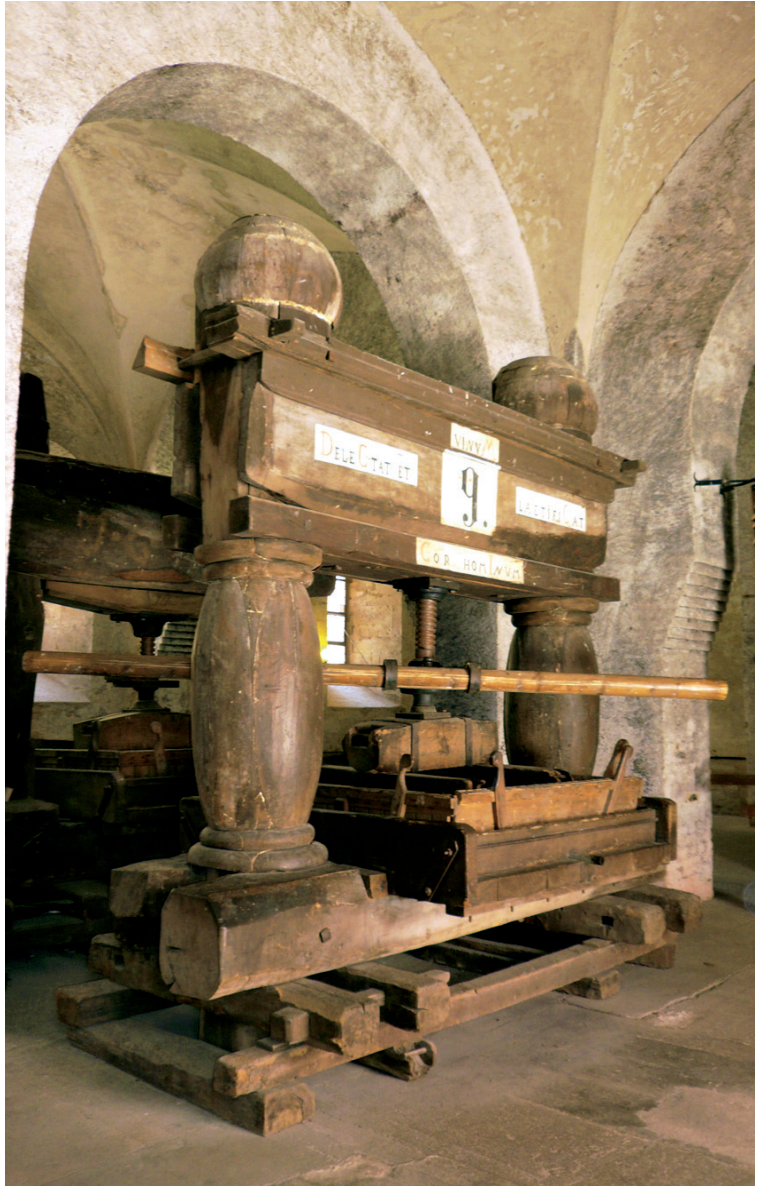
Presă de struguri din evul mediu

țiile pe care le avea acesta în Pantheonul grecesc, dar cu numele schimbat în Bacchus. Sărbătorile organizate în cinstea lui Dionisos în Grecia Antică și mai târziu în cinstea lui Bacchus în Imperiul Roman se transformau de cele mai multe ori în orgii decadente. Biblia, cartea de căpătâi a creștinătății, subliniază și ea granița subțire existentă între efectul pozitiv și cel negativ al vinului asupra ființei umane. După potop, când Pământul era pustiu și gol, prima plantă sădită de Noe, care este considerat cel dintâi agricultor