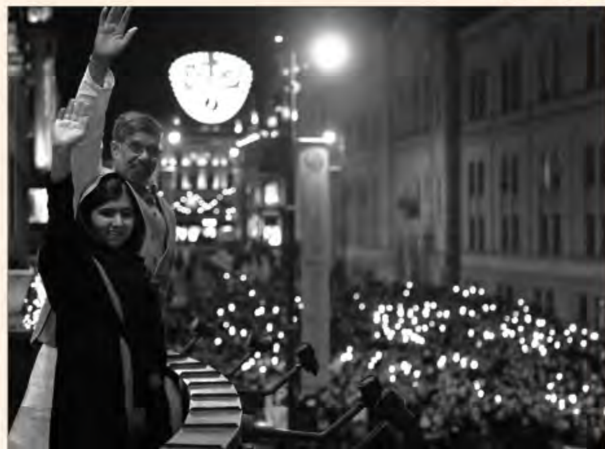
Finetik Varfol / AFP

S-a născut în anul 1929, în Atlanta, în sudul Statelor Unite. În regiunea lui, ca și în Africa de Sud, oamenii de culoare nu aveau dreptul de a se amesteca cu albi. Existau cartiere de negri și cartiere de albi. Școlile, restaurantele, autobuzele erau diferite pentru albi și pentru negri. Martin Luther King, pastor metodist de culoare, s-a luptat pentru drepturile civile ale negrilor americani. El a întreprins acțiuni non-violente de rezistență pentru interzicerea legilor rasiste și pentru lupta împotriva sărăciei, punându-și astfel viața în pericol. El visa la o lume în care să existe libertate și dreptate pentru toți. Din păcate, după ce a reușit să câștige numeroase bătălii împotriva segregării, a fost asasinat în 1968, la patru ani după ce îi fusese decernat Premiul Nobel pentru Pace.