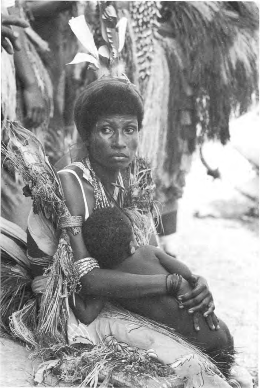
Planșa 1. Mamă și copil din ținuturile litoralului nordic al Noii Guinee (insula Siar).